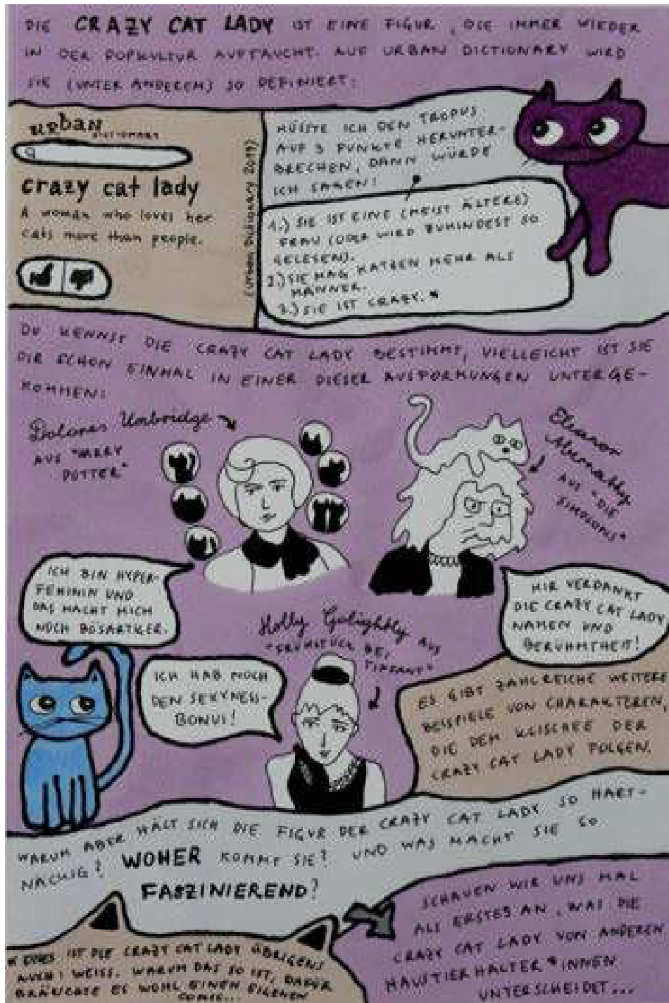
Abb. 1: Beispielseite aus dem Comic The Crazy Cat Lady der Studierenden Camilla Geisselbrecht (2022).